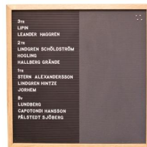
Woodline Light 2-fack. Inredd med gummipannå samt puretyg.