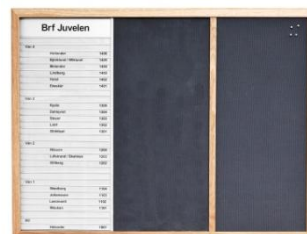
Woodline Light 3-fack. Inredd med lameller samt puretyg.

Woodline Light tillverkas som standard i massiv ek men kan också fås i bok eller björk. För att passa övrig interiör kan vi också betsa Woodline Light i önskad kulör med Woodstain.