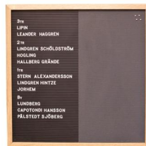
Woodline Light 2-fack. Inredd med gummipannå samt puretyg.