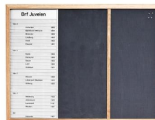
Woodline Light 3-fack. Inredd med lameller samt puretyg.

Woodline Light tillverkas som standard i massiv ek men kan också fås i bok eller björk. För att passa övrig interiör kan vi också betsa Woodline Light i önskad kulör med Woodstain.