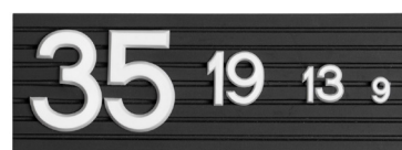
Gummipannå för textsättning med plastbokstäver