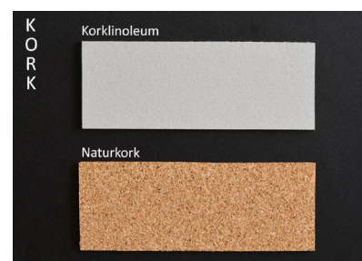
Korktytor för fästning med nål.

För att fästa anslag så finns det också flera alternativa anslagsytor. Både beroende på hur man vill fästa informationen, men kanske främst vilket utseende man är ute efter. Vårt fina möbeltyg finns i flera färger för att kunna anpassas både till ramfärg och övrig inredning. Här fäster man informationen med korta knappnålar. Möjligheten att få kork som anslagsyta finns också både i naturkork och korklinoleum. Önskar man fästa informationen med magnet, så har vi en grå magnetplåt som standard. Magnetplåten går också att lacka i önskad kulör.