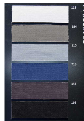
Tygtyor för fästning med nål.