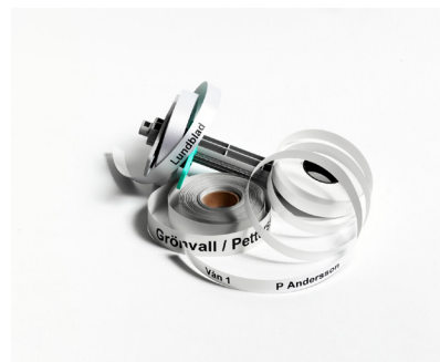
Namnremсор i 13 och 19mm